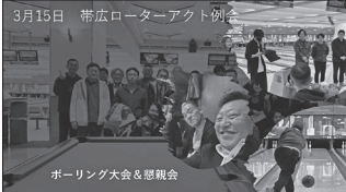
3月15日 帯広ローターアクト例会

3月15日は世界ローターアクトデーに合わせてポーリングと懇親会でロータリアンと親睦を深める例会となりました。私は体調不良で欠席しております。