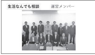
生活なんでも相談