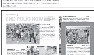
END POLIO NOW