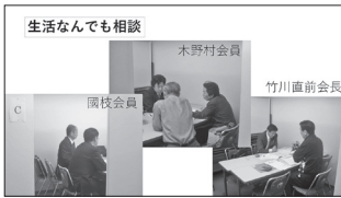
生活なんでも相談