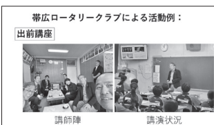
帯広ロータリークラブによる活動例：

みなさんこんにちは。今日は職業奉仕月間の最終日です。先週の会長報告でもお話ししましたロータリアンの行動規範の3つ目、自分の職業スキルを生かして、若い人々を導き、特別なニーズを抱える人々を助け、地域社会の人々の生活の質を高めるという部分での過去の活動事例を紹介いたします。