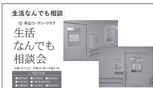
生活なんでも相談

当時職業奉仕月間は10月でしたが、実施は4月11日、記憶にないのですが、多分準備が間に合わなかったのかもしれませんが。新聞に開催の広告と告知記事を掲載していただき藤丸の8階にあった帯広市市民活動センターにて開催。