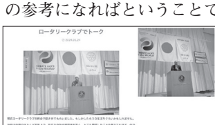
ロータリークラブでトーク