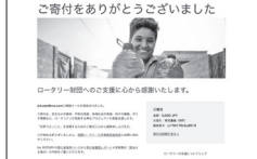
ご寄付をありがとうございました