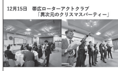
12月15日 帯広ローターアクトクラブ「異次元のクリスマスパーティー」