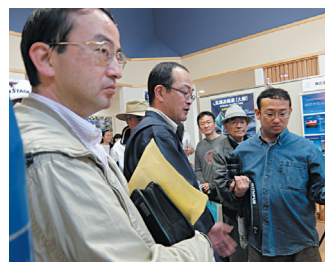
元宇宙少年の二人