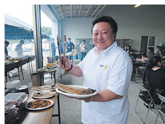
親方、ご馳走様でした。