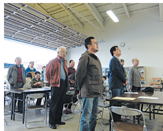
ロータリーソング