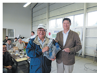
抽選会（ニコニコ献金）