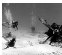
サイバンに沈む戦闘機