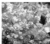
イバラカンザシゴカイ