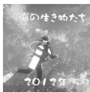
ヌサペニダ島近海

みなさんこんにちは、去年に引き続いてスキューバダイビングで遭遇した海の生き物たちをお話します。ダイビングをした方であれば絶対に見ることのできない海の世界をご紹介します。今回の海は主にバリ島のヌサペニダ島近海で撮影した映像です。皆さんサンゴは植物でしょうかそれとも動物なのでしょうか？サンゴはクラゲやイソギンチャクなど刺胞動物に属する動物（サンゴ虫）のうち固い骨格を発達させた種を言います。褐虫藻という藻類を共生させており、それらの光合成産物によってエネルギーを供給されてサンゴ礁を形成しています。また、サンゴ礁によく生息するものにはゴカイという生き物があります。頭に房のような鰓冠（さいかん）を持ち、これで呼吸をしながらプランクトンなどの浮遊生物も捕らえることができ、口に運ぶことになっています。その他にも普段は石の下や岩の隙間に隠れていることが多いのですがヒラムシという生き物がいます。見かけと違って肉食性で小動物（貝など）を襲って餌にしています。このように海では様々な生き物に出会うことができますので皆さんも一度潜ってみては如何ですか。